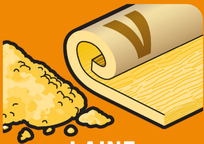
LAIN DE VERRE