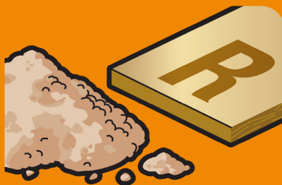
LAIN DE ROCHE

Laine sèche ou peu humide en panneau ou soufflée (revêtement kraft autorisé)